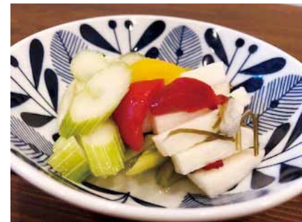
ARIKA特製ピクルス 400円 (税抜)

季節の食材を使った日替わりメニューやランチの前菜などに旬の地元野菜を取り入れています。あぐりっち佐野店にはさまざまな旬の野菜や珍しい野菜も並んでいるので、訪れるのが楽しみです。人が集い、美味しいものが集まる「宝の“あrika”」をコンセプトにした洋食noARIKAでは、旬の地元食材がメニューを彩ります。お客様の大切な時間を共有し、つどい、人が集まれる場所となれるよう皆様のお越しをお待ちしています。