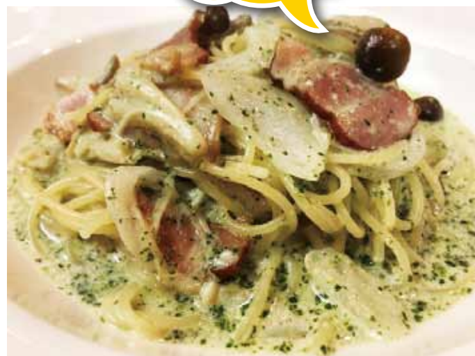
ベーコンときのこのクリームジェノベーゼ 950円 (税抜)