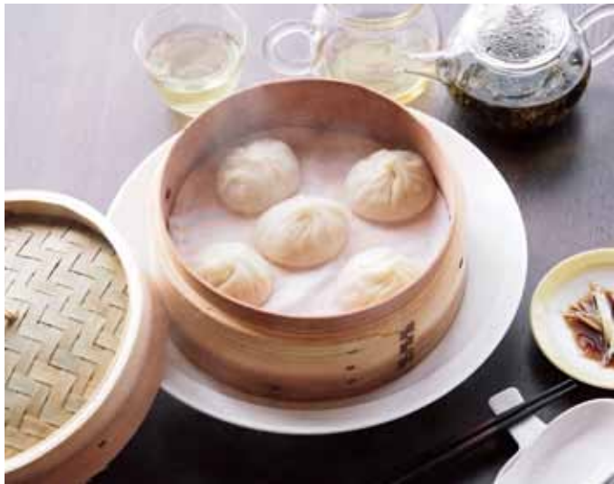
ショウロン タン パオ 小籠湯包【5個入り】 600円 (税抜)