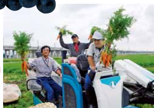
(株)クボタファーム 紅農友会