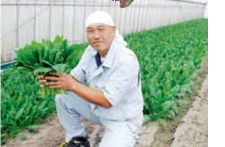
K'sファーム ほうれん草、西洋野菜

まるでフルーツのような甘さで、生でも食べられる真っ白なトウモロコシ。この他、ニンジン、キャベツ、さといも等、年間を通して様々な野菜を栽培。