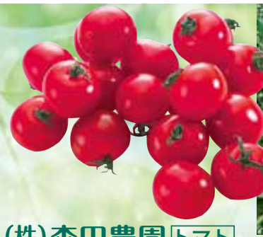
(株)森田農園 トマト

住 所 高岡市下黒田 780-6 電 話 0766-60-8049 営業時間 ランチタイム 11:00 ~ 15:00 (LO 14:30) ディナータイム 18:00 ~ 22:00 (LO 21:00) 定 休 日 水曜日、不定休あり H P r.goope.jp/yarika