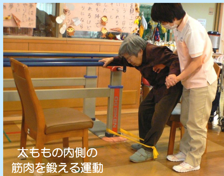
太ももの内側の 筋肉を鍛える運動