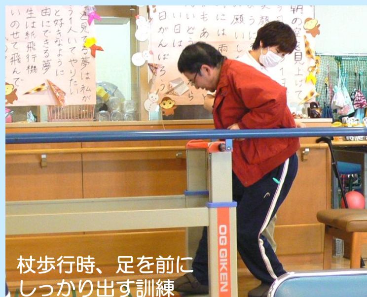
杖歩行時、足を前に しっかり出す訓練