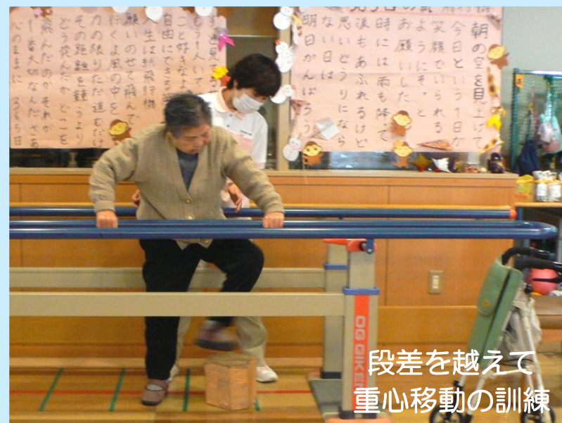
段差を越えて 重心移動の訓練