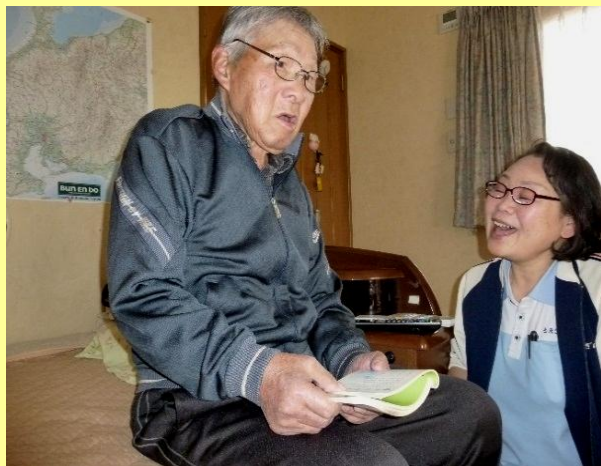
▲訪問サービスの様子 ご利用者様の自宅で一緒に歌を唄う

ご利用者様の中には、名前はなかなか覚えることができなくても、「みんなの顔はよく知っとるよ！」ともえぎの里へ来られることで安心される方もいらっしゃいます。