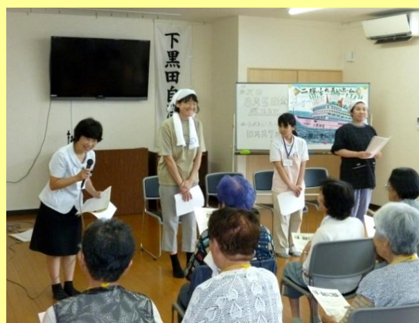
▲二塚公民館へ外出 (地域での介護予防教室の見学)