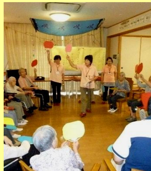
▲地域ボランティアの方との交流会

顔なじみの皆さんが、和気あいあいといつまでも笑顔がたえることなく元気に過ごしていただけるように、これからも支援させていただきます。