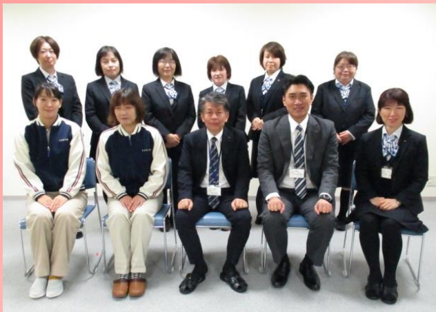
センター長・センター長補佐・居宅介護支援センター ホームヘルプステーション・事務の職員