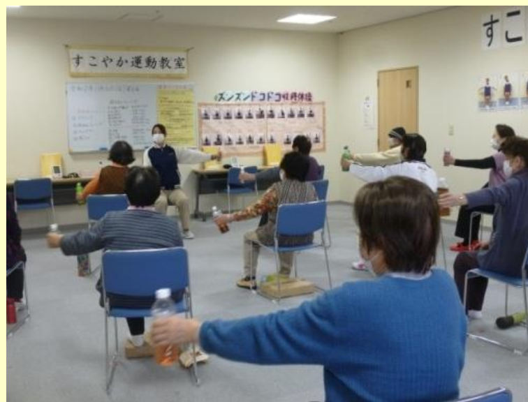
ペットボトルを使って上肢の運動

ご自宅にある道具を使つての運動や脳トレ等も取り入れ、楽しく運動をしていただけるようにしています。