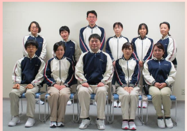
小規模多機能型居宅介護の職員