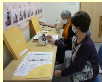
運動の前後には健康チェック