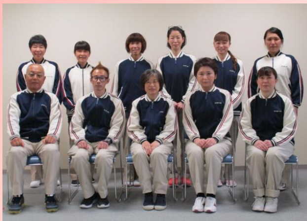
デイサービスの職員

皆様方には、健やかに新春をお迎えのこととお慶び 申し上げます。住み慣れたご自宅で暮らし続けること を支えることができる「もえぎの里」を目指し職員一 同努力してまいります。