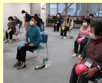
骨盤底筋を鍛える運動