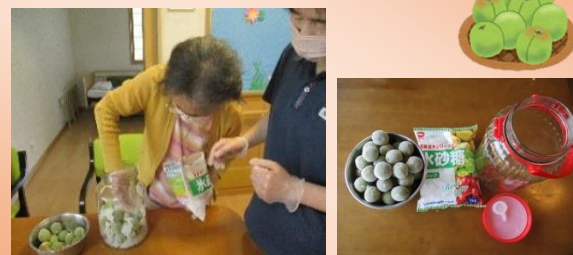
美味しくなりますように！