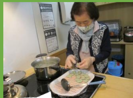
昔は、よう手作りしたわ

小多機では6月16日和菓子の日になんで、ヨモギ団子作りを行いました。手作りの紫陽花のランチョンマットを敷き、皆さんで美味しくいただきました。