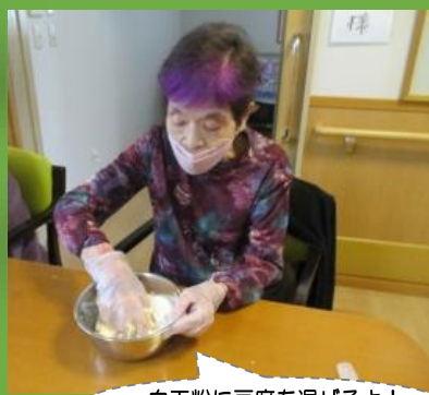
白玉粉に豆腐を混ぜるよ！