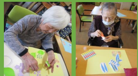
ランチョンマットを作っています。 貼りつけ作業は手指のリハビリになります。